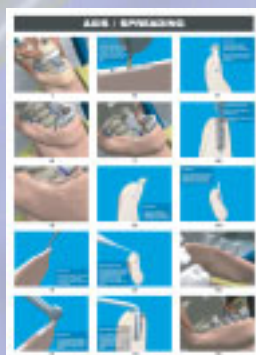
Plakat Axis / Spreading

3D.Bonemanagement optimiert Ihre Ressourcen, oder stellt zusätzliche Inhalte her. Die Bestandteile werden in ein ansprechendes Layout eingefügt und als Druckdateien, aber auch als Dateien welche im Internet gezeigt werden können, exportiert. Selbstverständlich können die Endprodukte auch einfach per E-Mail verschickt werden.