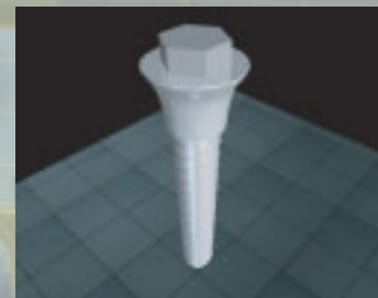
3D-Modell eines Implantats