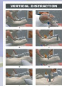
Flyer Vertikale Distraction