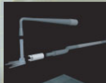
3D-Modell eines Distraktors

Die Modelle können auch vergrößert und verkleinert werden. Dadurch ist es möglich, Modelle bis ins kleinste Detail zu begutachten.