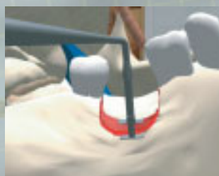
Anheben des Distraktors