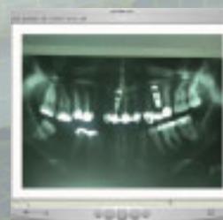
Film nach der Bearbeitung