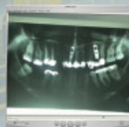
Film vor der Bearbeitung

Selbstverständlich werden die CDs oder DVDs mit einem ansprechenden Design bedruckt und in einer edeln Hülle geliefert (inklusive Einlagen).